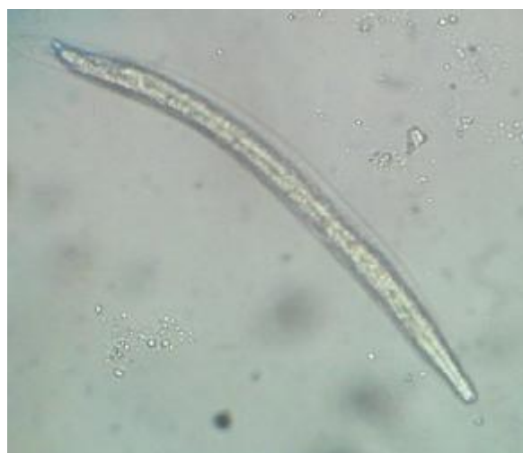
شکل ۲: مرحله سوم لاروهای عفونی‌زای نماتودی جدا شده از سبزیجات مزارع اطراف اهواز