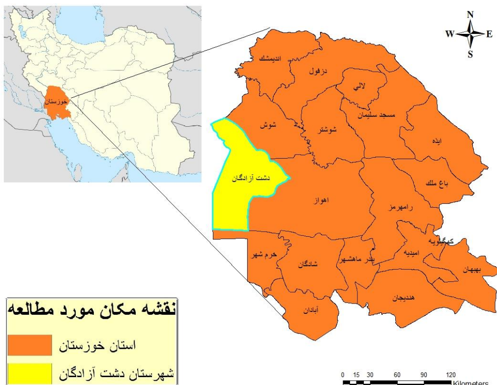
شکل ۱: شهرستان دشت آزادگان، استان خوزستان

در مجموع افراد مورد مطالعه ۷۸۶ نفر (۵۹٪/۵۴) دارای یک زخم، ۲۲۸ نفر (۱۷٪/۲۷) دارای دو زخم و ۳۰۶ نفر (۲۳٪/۱۸) دارای سه زخم یا بیشتر بودند و تعداد ضایعات فعال بر روی بدن بیماران بین ۲۱ تا ۲۱۱ عدد بود.