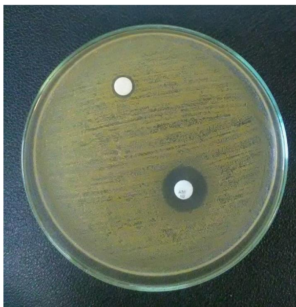
شکل ۳: مهار رشد باکتری استافیلوکوکوس اورئوس با نانوامولسیون روغن کرچک و استفاده از آنتی بیوتیک آموکسی سیلین به عنوان کنترل مثبت