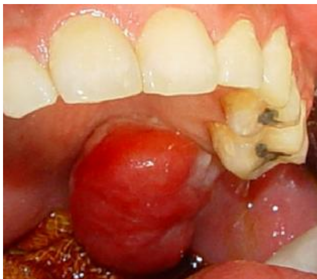
شکل ۱: نمای کلینیکی ضایعه که توده ای با سطح صاف و اریتماتوز نشان می دهد.

یک خانم ۲۵ ساله با شکایت از توده ای بدون درد در ناحیه کام سخت به مدت ۲ سال، به کلینیک دندانپزشکی