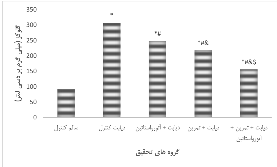
نمودار ۲. مقایسه میانگین گلوکز سرمی در گروه‌های تحقیق