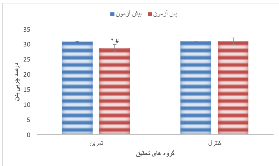
نمودار ۲ ، تغییرات درصد چربی بدن در گروه های تحقیق

کاهش معنی دار نسبت به پیش آزمون* کاهش معنی دار نسبت به گروه کنترل#