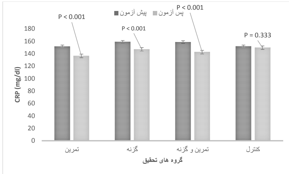
نمودار ۲: تغییرات CRP در گروه‌های تحقیق