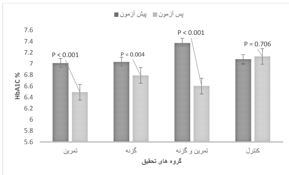
نمودار ۳: تغییرات HbA1C در گروه‌های تحقیق