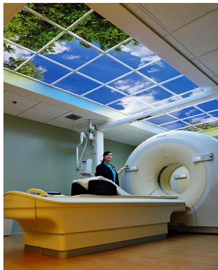
شکل ۴: مرکز پزشکی یادبود گالفپورت، فلوریدا (۱۰)