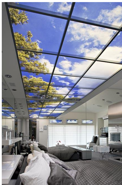
شکل ۵: محل اقامت کن، ایالات متحده آمریکا (۱۰)