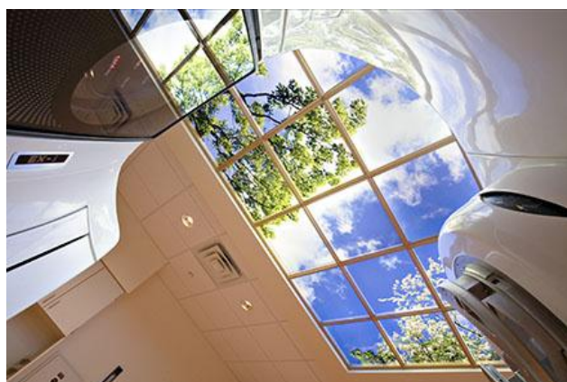
شکل ۷: مرکز درمان سرطان ام.سی.کری، آمریکا (۱۰)