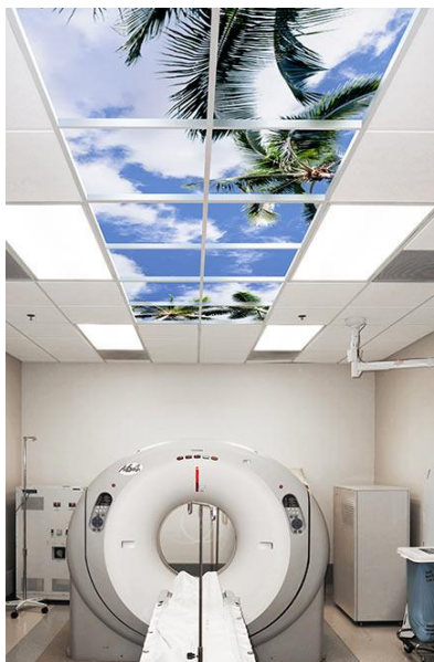
شکل ۶: مرکز پزشکی انجمن هنفورد، آمریکا (۱۰)