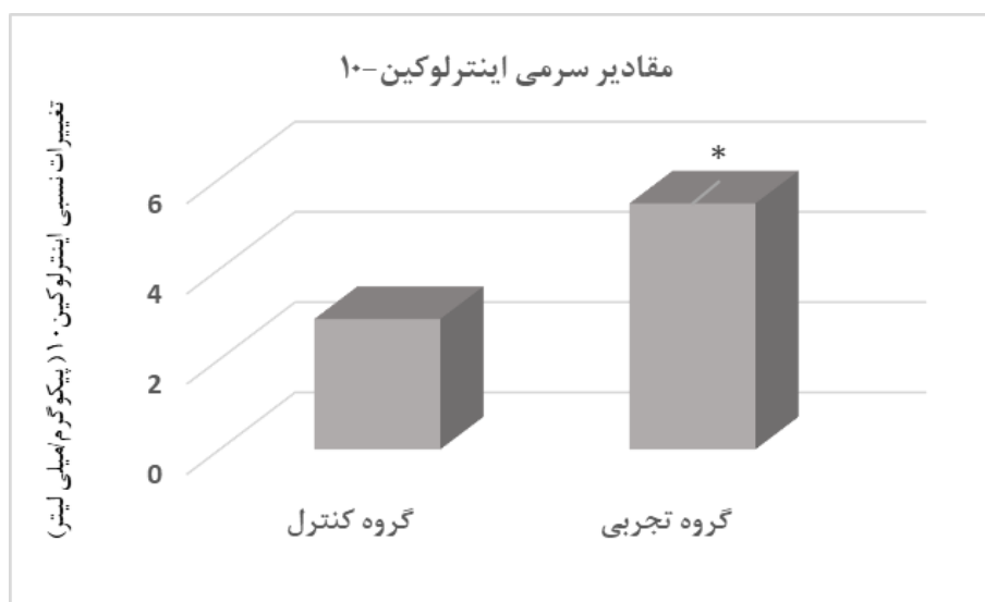
نمودار ۱. تغییرات اینترلوکین ۱۰ در گروه تجربی و کنترل