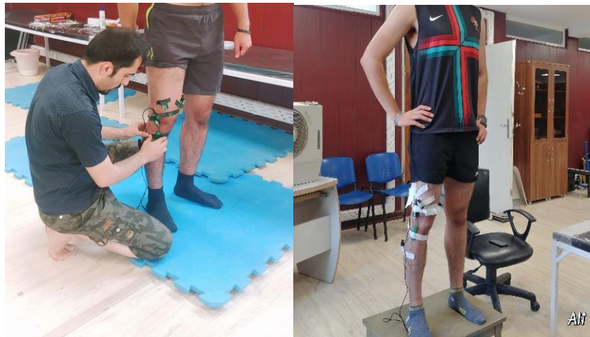
شکل ۱: الکتروود گذاری قبل از فرود

جدول ۸ نتایج آزمون تعقیبی بون فرونی را نشان می دهد. بین فعالیت عضلانی در زمان های پیش آزمون- اصلاح تکنیک، پیش آزمون- خستگی و اصلاح تکنیک،