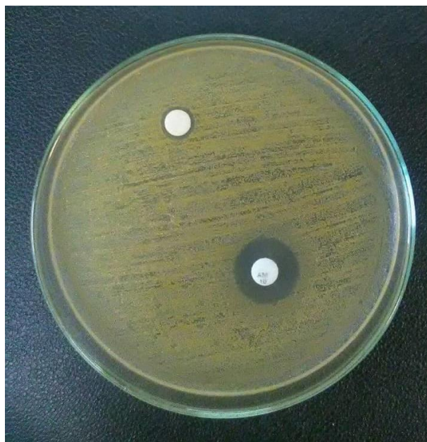
شکل ۳: مهار رشد باکتری استافیلوکوکوس اورئوس با نانوامولسیون روغن کرچک و استفاده از آنتی بیوتیک آموکسی سیلین به عنوان کنترل مثبت